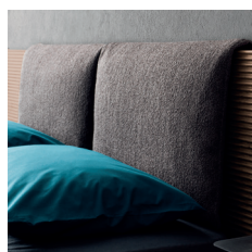
Cuscini per testiera Headboard cushions