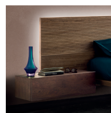
Led ad incasso Recessed led