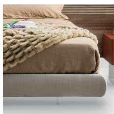
Piedini in plexiglass Feet in plexiglass