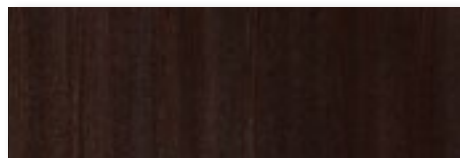
FTM - Frassino tinto Testa di Moro/ Dark Brown stained Ash