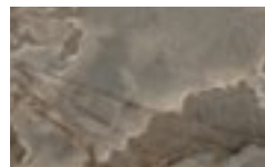
CM4 - Alabastro lucido/ Glossy Alabastro