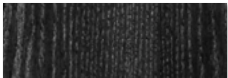
FNR - Frassino tinto Nero/Black stained Ash