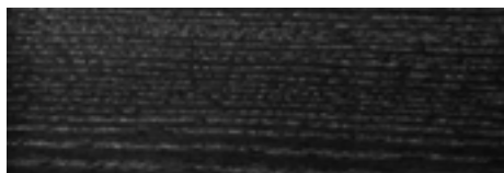
FNR - Frassino tinto Nero/Black stained Ash